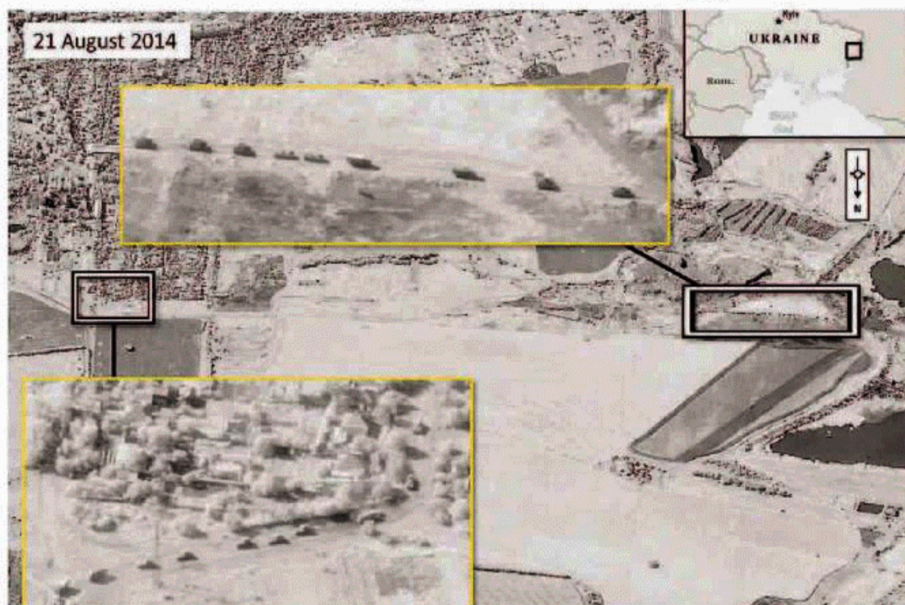
Una foto satellitare diffusa dalla Nato che mostra i carri armati russi in Ucraina

> I blindati russi sconfinano, più di mille soldati sul suolo di Kiev > Giù i mercati, riunione d'emergenza Onu. Obama: è aggressione